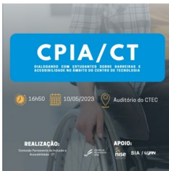
Figura 2: Material de divulgação do evento da CPIA/CT com os estudantes com NEE que foi compartilhado nas redes sociais do CT.

A segunda ação, compreendida como um desdobramento da primeira, consistiu no envio de formulário a todos os estudantes com NEE da unidade com perguntas relacionadas às percepções deles sobre barreiras e facilitadores à inclusão no âmbito do CT. Assim como também foi disponibilizado espaço para escuta individualizada dos alunos, caso solicitado.