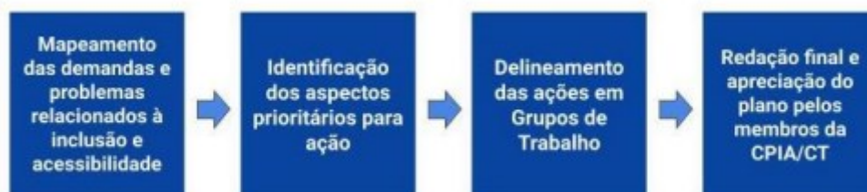
Figura 1: Fluxo dos processos adotados na elaboração do plano de ação.

O plano de ação da CPIA do Centro de Tecnologia foi construído de forma colaborativa com a participação de seus membros e dos estudantes com NEE matriculados nos cursos do centro e acompanhados pela Secretaria de Inclusão e Acessibilidade (SIA). Partindo do pressuposto de que a acessibilidade engloba um conjunto de dimensões e tendo como referência o Plano de Ação da EMUFRN, fruto de construção colaborativa no âmbito da referida unidade, foram utilizados os mesmos procedimentos, conforme quadro abaixo: